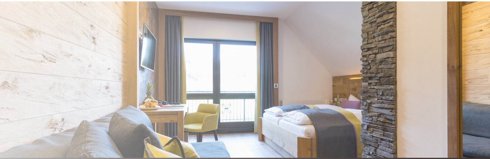
Natur Panorama Zimmer